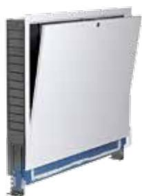
Unterputz und Leichtbau